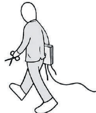
Illustratie Tomas Schats