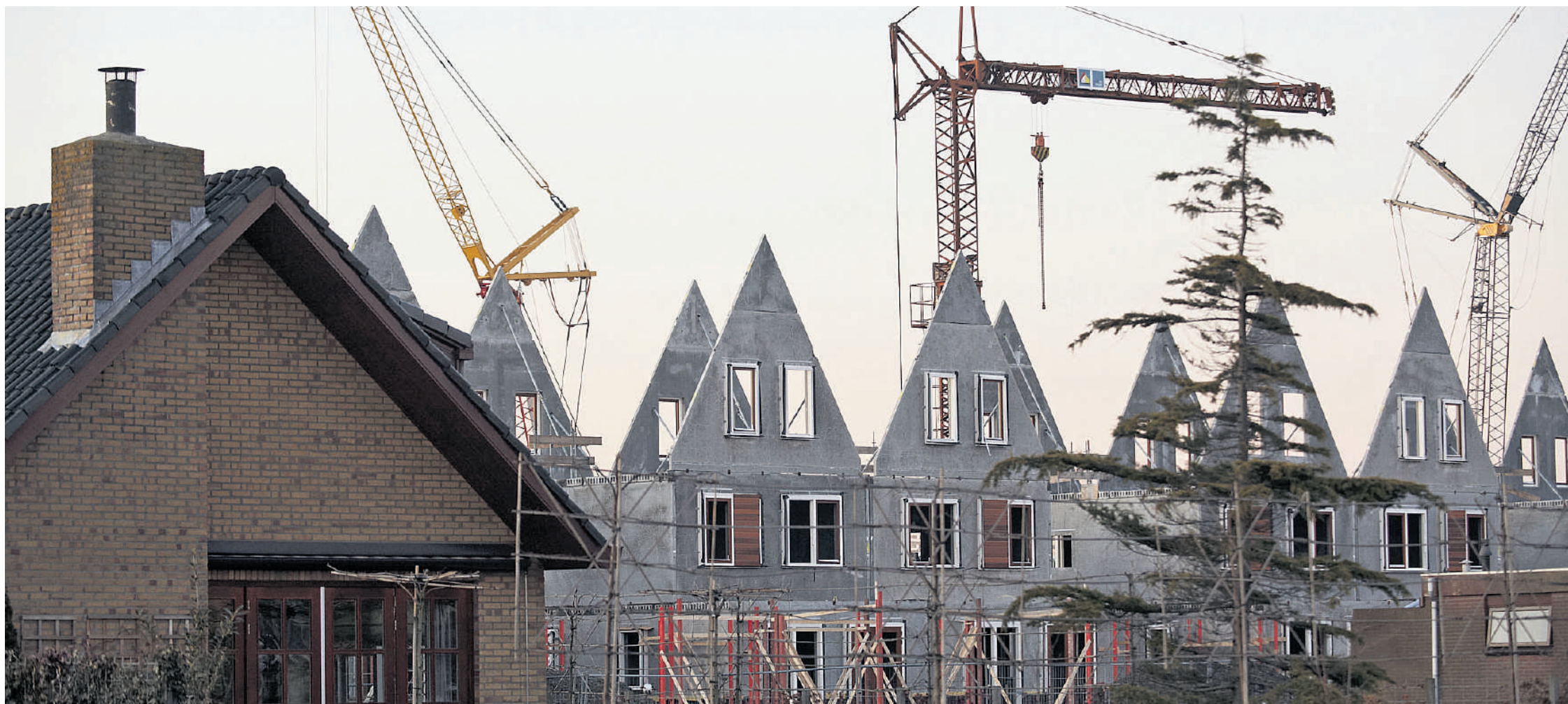
Nieuwbouwproject in Bergschenhoek, bij Rotterdam. De meest negatieve voorspelling gaat uit van op 60.000 nieuwe woningen in 2009, een daling van 25 procent.

Het effect van economische crises is volgens directeur Taco van Hoek van het Economisch Instituut voor de Bouw (EIB) altijd wat later merkbaar op de wo-